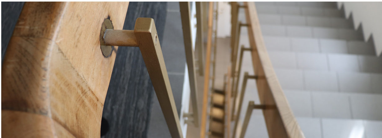
Mynd 1. Nýtt leiguhúsnæði Dómsólásýslunnar er á 3. hæð, Suðurlandsbraut 14.