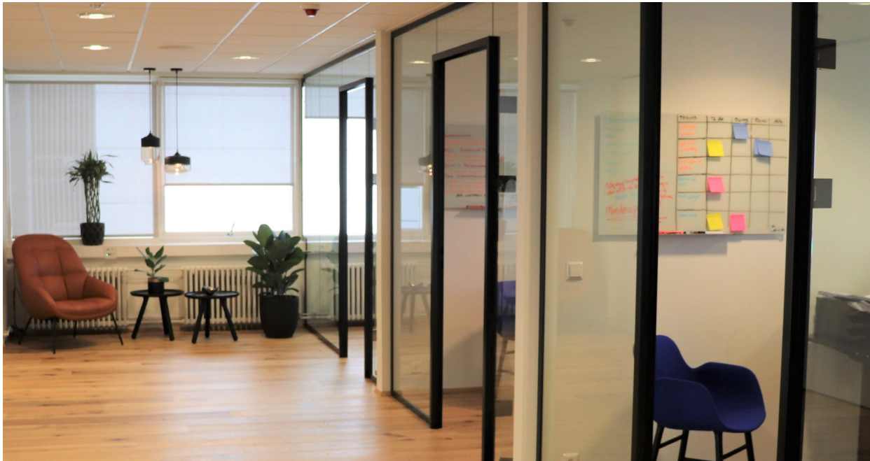
Mynd 2. Setkrókur og skrifstofurými.