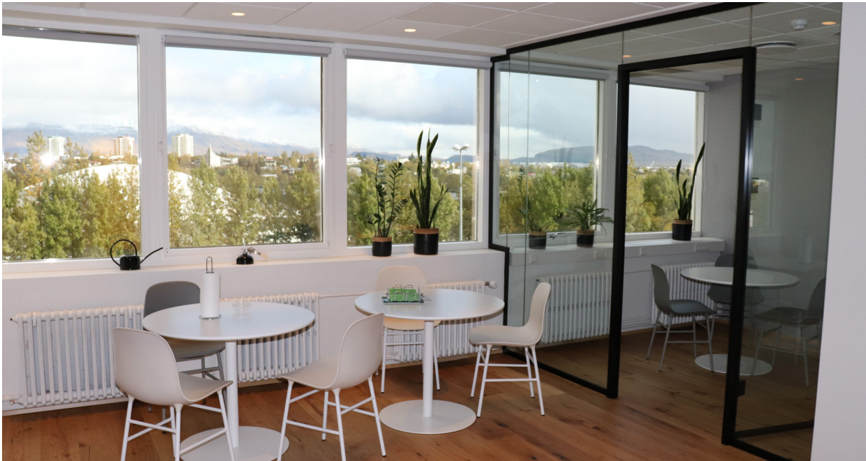
Mynd 4. Kaffistofa og fundarými.

Dómstólasýslan. Samningurinn var undirritaður í febrúar 2018 og er til fimm ára.