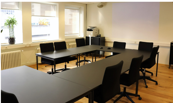
Mynd 5. Fundar- og fyrirlestrarými.